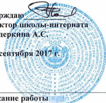
График работы педагога-психолога на 2017-2018 учебный год